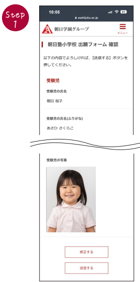
出願フォームの確認画面