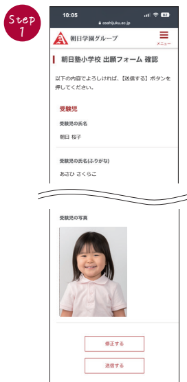
出願フォームの確認画面