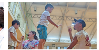
トップアスリート運動教室