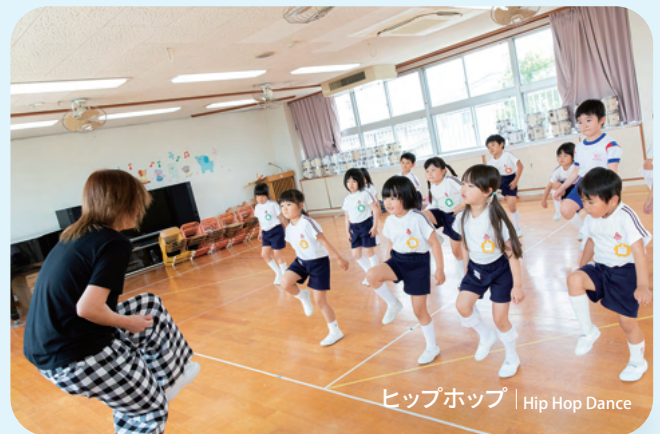
ヒップホップ | Hip Hop Dance