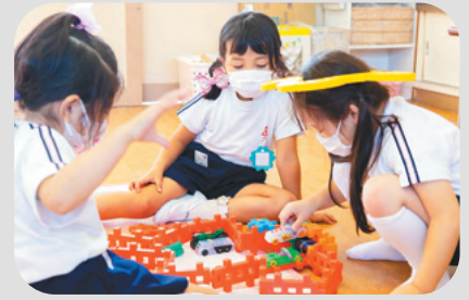
先生も友達も一緒 おやつ時間もあまるよ

本園の預かり保育は、保護者の就労の有無に関係なく、2歳児から5歳児まで、月曜日から土曜日まで毎日でも、1日だけでも利用できます。夏休みなどの長期休みの間もお預かりし、子育てを全力でサポートしています。預かり保育を利用する園児は100名以上。午後には楽しいおやつ時間も、クラスを超えて異年齢の友達と一緒に過ごします。