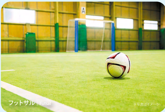
フットサル | Futsal