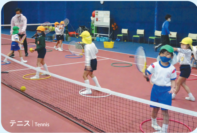
テニス | Tennis