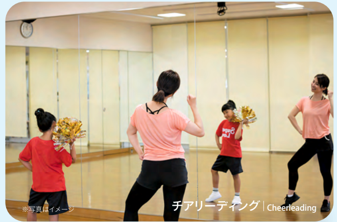
チアリーディング | Cheerleading